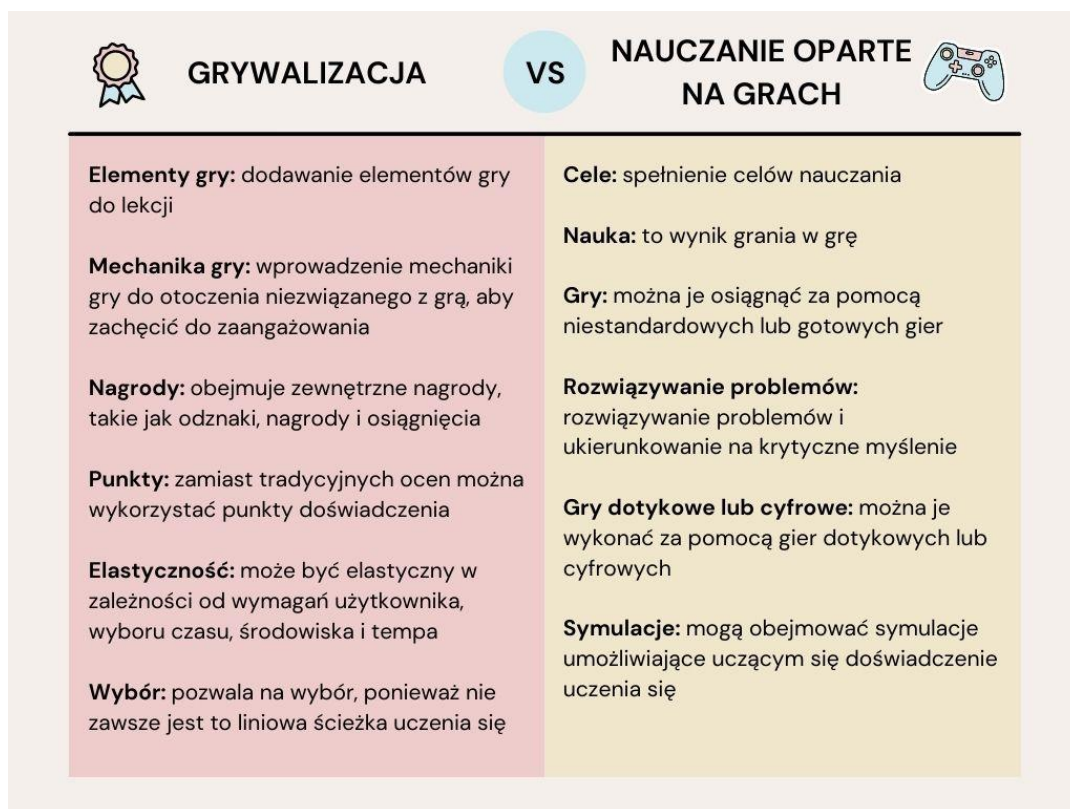
Rys. 1: Grywalizacja i uczenie się oparte na grach - przegląd